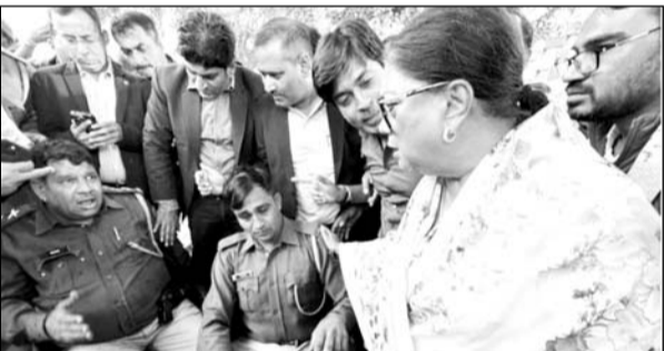
जानकारी मिलते ही वसुंधरा राजे घायल पुलिसकर्मीयों के पास पहुंची।

पाली, (नि.सं.)। पाली जिले में पूर्व मुख्यमंत्री वसुंधरा राजे के काफिले की एस्कोर्ट कर रही पुलिस की जीप पलट गई। हादसे में कुछ पुलिसकर्मी घायल हो गए, जिन्हें बाली के राजकीय अस्पताल में भर्ती कराया गया है।