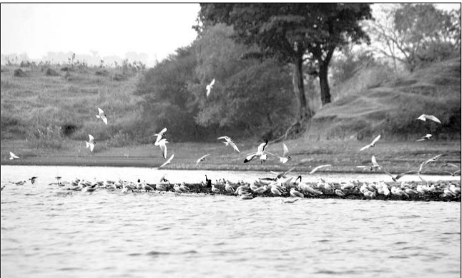
माही डेम की अथाह जलराशि में अठखेलियां करते प्रवासी परिंदे।

बांसवाड़ा, (नि.सं.)। सर्दी बढ़ने के साथ जिले में प्रवासी परिंदों की संख्या बढ़ती जा रही है। पर्यावरण प्रेमियों को इनकी गतिविधियां आकर्षित कर रही हैं। वहीं माही डेम में प्रवासी पक्षियों का कलरव गूज रहा है।