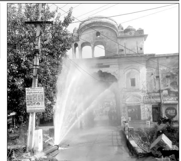
पानी सप्लाई शुरू होने पर ऊपर तक पानी का फव्वारा निकलता है।