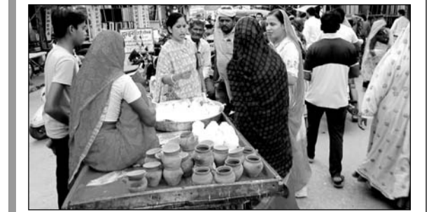
गंगापुर सिटी में करवा चौथ की पूर्व संध्या पर बाजार में करब खरीदती महिलाएं।