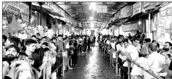
डिग्गी लकखी मेले में श्रीजी के दर्शन के लिये आस्था का सैलाब उमड़ा।

कल्याण भक्तों की सेवा-चाकरी की लोगों में होड़ सी मची हुई है। जयपुर रोड बजरी नाँके के पास लगे श्रीजी भंडारा व डिग्गी मोड़ से आगे लगे श्याम मित्र मंडल के भंडारे में अपनी सेवाएँ दे रहे सेवक पदायत्रियों में कल्याणधणी का वास मानकर उनके चरण धोने व भंडारे में तैयार किये गये कई प्रकार के व्यंजन भक्तों को परोसकर स्वयं को श्रीजी के समीप होने का अहसास कर रहे हैं। डिग्गी तीर्थ की ओर आने वाले छोटे से बड़े हर