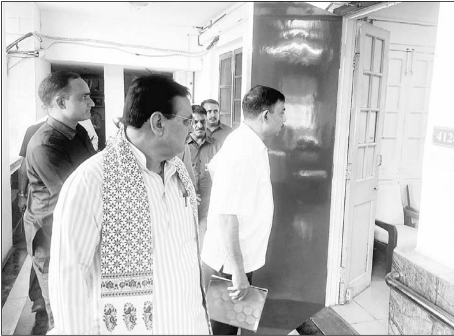
मुख्यमंत्री भजनलाल शर्मा ने मंगलवार को सुबह अचानक सचिवालय की मुख्य बिल्डिंग में निरीक्षण करने के लिए पहुंच गए। इस दौरान सी.एम.ने सचिवालय के मुख्य भवन में करीब 10 मिनट बिताए।