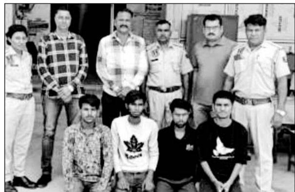
मुहाना थाना पुलिस ने नाबालिग के अपहरण की वारदात को अंजाम देने वाले युवकों को गिरफ्तार किया।

मुहाना थाना पुलिस ने साजिश रचने वाले नाबालिग को निरुद्ध कर, अपहरण की वारदात को अंजाम देने वाले 4 युवकों को गिरफ्तार किया