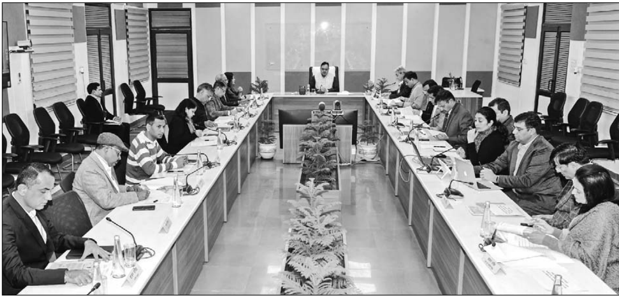
मुख्यमंत्री भजनलाल शर्मा ने वीडियो कॉन्फ्रेंसिंग (वी.सी.) के माध्यम से जिला कलेक्टरों की एक बैठक ली। जिसमें बजट घोषणा के विकास कार्यों के लिए भू-आवंटन के प्रकरणों के निस्तारण में तेजी लाने के निर्देश दिए।