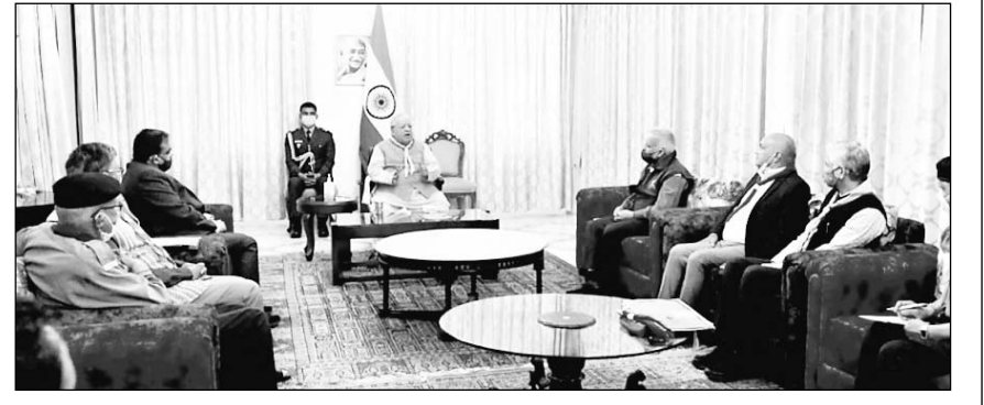
राज्यपाल कलराज मिश्र ने बुधवार को राजभवन में स्काउट गाइड संगठन के नए पदाधिकारियों से मुलाकात की।

जयपुर, (का.सं.)। राज्यपाल कलराज मिश्र ने कहा है कि स्काउट गाइड संगठन को राष्ट्रिय महात्मा गांधी के दर्शन और विचारों का प्रसार करने में अपनी महत्वपूर्ण भूमिका निभानी चाहिए। उन्होंने कहा कि गांधी के विचारों से नई पीढ़ी को जोड़ने की जरूरत है। उन्होंने कहा कि गांधी दर्शन के अंतर्गत आचार व्यवहार की शुद्धता, गरीब बर्तियों में कार्य, स्वच्छता आदि में इस संगठन की अग्रणी भूमिका हो। राज्यपाल एवं राजस्थान राज्य