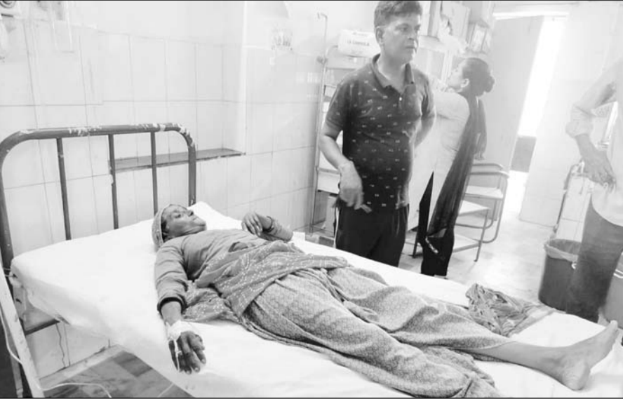
महिला को प्राथमिक उपचार के बाद जयपुर एसएमएस अस्पताल रेफर किया।