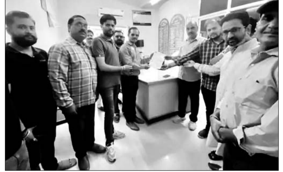
श्री राजपूत करणी सेना गंगापुर सिटी व राजपूत समाज ने जिला कलेक्टर के पीए को ज्ञापन दिया।

श्री राजपूत करणी सेना गंगापुर सिटी व राजपूत समाज ने जिला कलेक्टर कार्यालय में ज्ञापन दिया