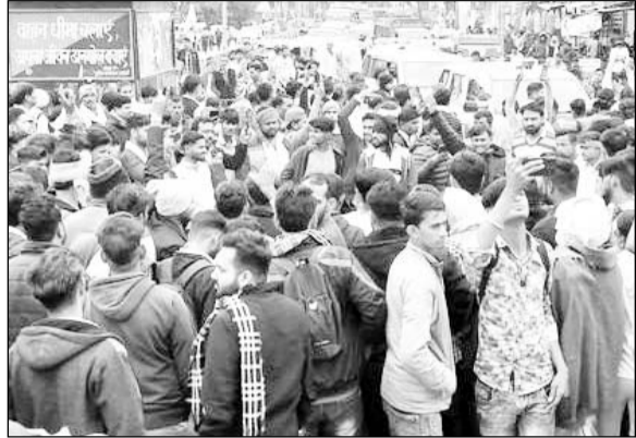
करौली कलेक्ट्रेट सफ़िकल पर पीड़ित परिवारजनों के साथ लोगों ने धरना देकर जाम लगाया।