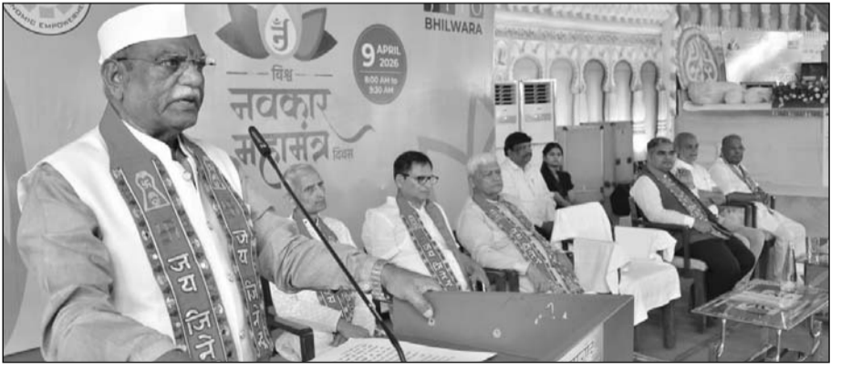
राज्यपाल बागड़े ने भीलवाड़ा में आयोजित विश्व नवकार महामंत्र दिवस समारोह को संबोधित किया।

इस दौरान राज्यपाल बागड़े ने कहा कि नवकार महामंत्र विश्व के प्राचीनतम एवं पावन मंत्रों में से एक है, जो अहिंसा, अपरिग्रह एवं अनेकतावाद जैसे सिद्धांतों पर आधारित है। यह मंत्र न केवल आध्यात्मिक उन्नति का मार्ग प्रशस्त करता है, बल्कि समाज में शांति, समृद्धि एवं सुशांति का भी संदेश देता है। वर्तमान वैश्विक परिस्थितियों में इसकी प्रासंगिकता और भी अधिक बढ़ गई है। राज्यपाल बागड़े ने जैन धर्म की महान परंपरा का उल्लेख करते हुए कहा कि