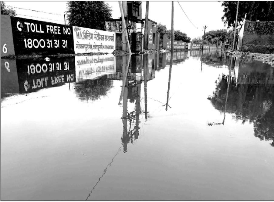
कोटपूतली में नालों का पानी सड़कों पर आया तो सड़कें दरिया में तब्दील हो गईं।

वही स्थिति कस्बे के गोपालपुर रोड व लक्ष्मीनगर के मध्य स्थित फौजावाली-