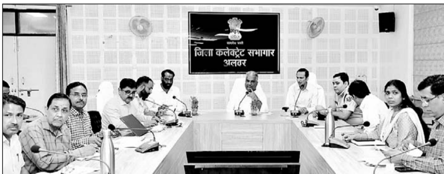
केंद्रीय वन, पर्यावरण एवं जलवायु परिवर्तन मंत्री भूपेंद्र यादव ने कलक्टेट सभागार में जिला स्तरीय अधिकारियों की समीक्षा बैठक लेकर जरूरी निर्देश दिये।

संबंधित अधिकारियों को जोड़े। उन्होंने कहा कि शहर की सफाई व्यवस्था में सिंगल यूज प्लास्टिक एक बड़ी बाधा है अतः नगर निगम सिंगल यूज प्लास्टिक के उत्पादन, संग्रहण एवं विक्रय पर कड़ाई से लगाने लगाने हेतु कार्यवाही करें। साथ ही आमजन को जागरूक करें कि सिंगल यूज प्लास्टिक