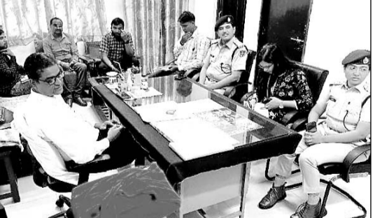
पर्यावरण संरक्षण के लिए 'गो ग्रीन अभियान' को सफल बनाने हेतु अधिक से अधिक वृक्षारोपण करवाने की बात कही।