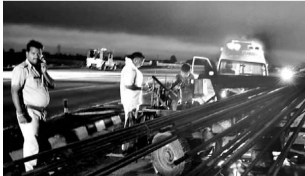
हाईवे पेट्रोलिंग कर्मचारियों ने सड़क मार्ग पर बिखरे सामान को सड़क से दूर करके यातायात सुगम करवाया।