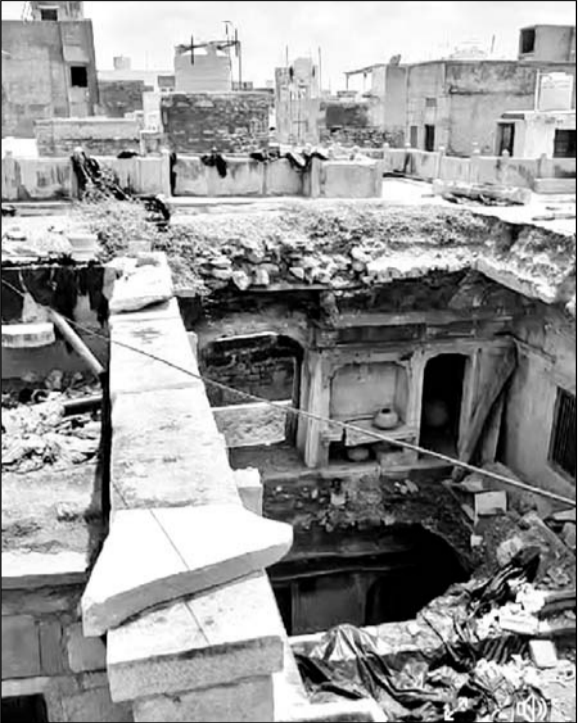
जैसलमेर शहर में पिछले दिनों आई बरसात से सोनार दुर्ग स्थित मकान की छत गिर गई।