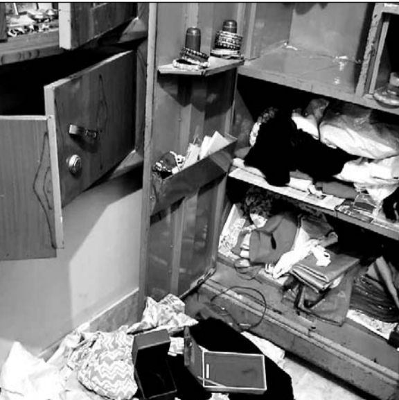
चोरी की वारदात के बाद सामान बिखरा पड़ा है।