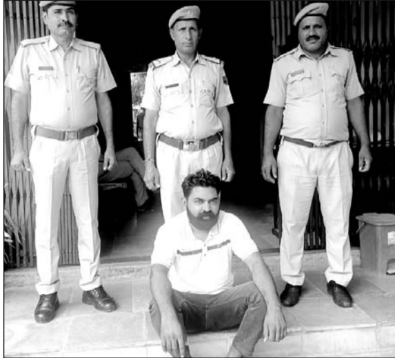
सिंधाना पुलिस ने डीजल व पेट्रोल की खरीद फरोख्त मामले में एक व्यक्ति को गिरफ्तार किया।

अभियान के तहत सूचना मिली की थाना क्षेत्र के भैसावता कलां में अवैध रूप से पेट्रोल व डीजल की खरीद फरोख्त की जा रही है। इस दौरान