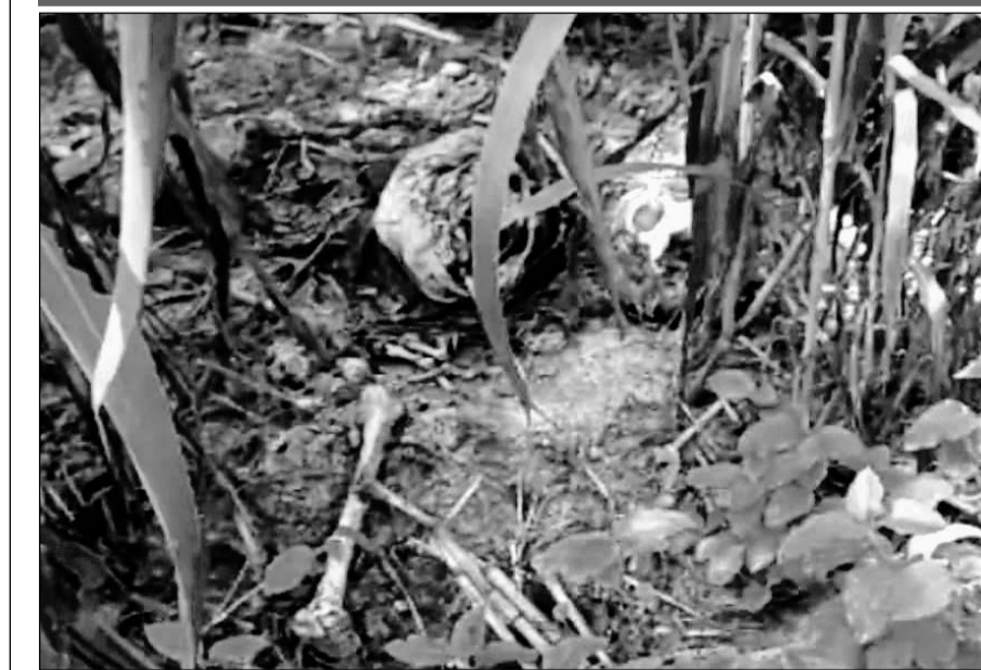
बिलोचो स्थित बावड़ी की ढाणी के एक खेत में नर कंकाल मिला।

कंकाल मिलने की जगह के पास ही पेड़ पर एक फंदा भी लटका मिला