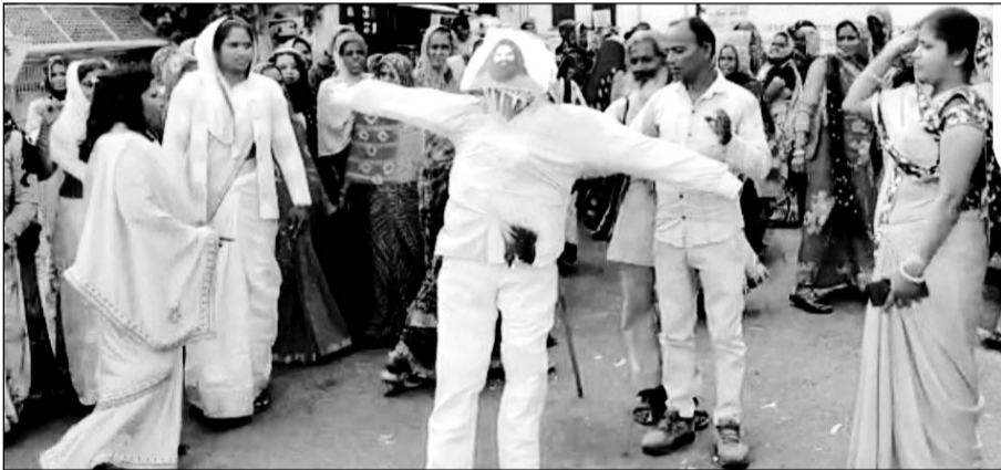
जिला कलेक्ट्री के बाहर बाबा रामदेव का पुतला दहन करते कांग्रेस महिला मोर्चा के कार्यकर्ता।