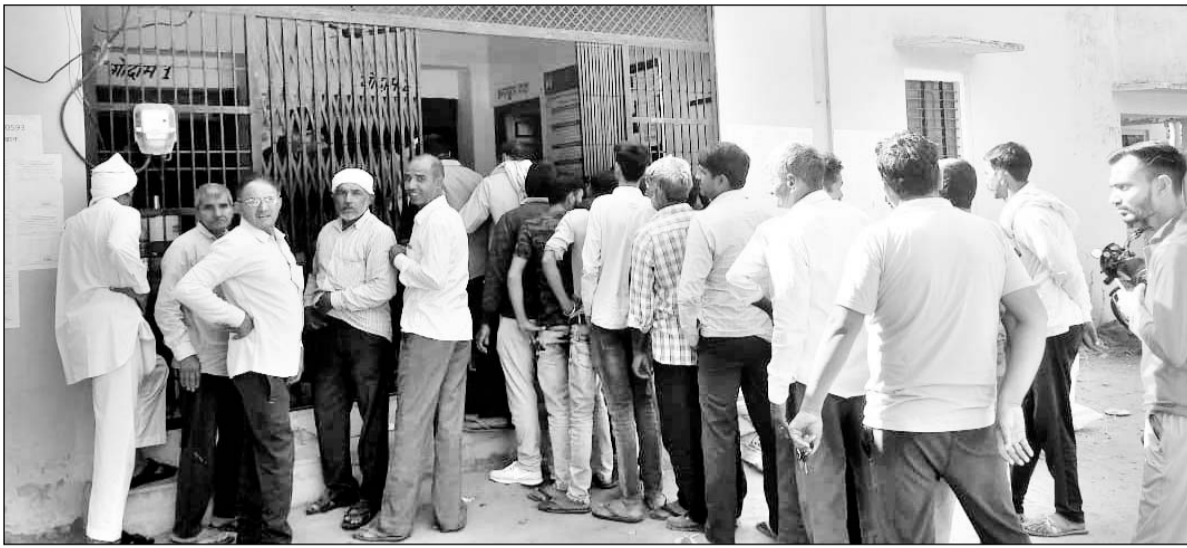
भैसावता ग्राम सहकारी समिति कार्यालय के बाहर लगी किसानों की लाइन।

यूरिया के लिए लाइन में खड़े किसान निराश होकर लौटे