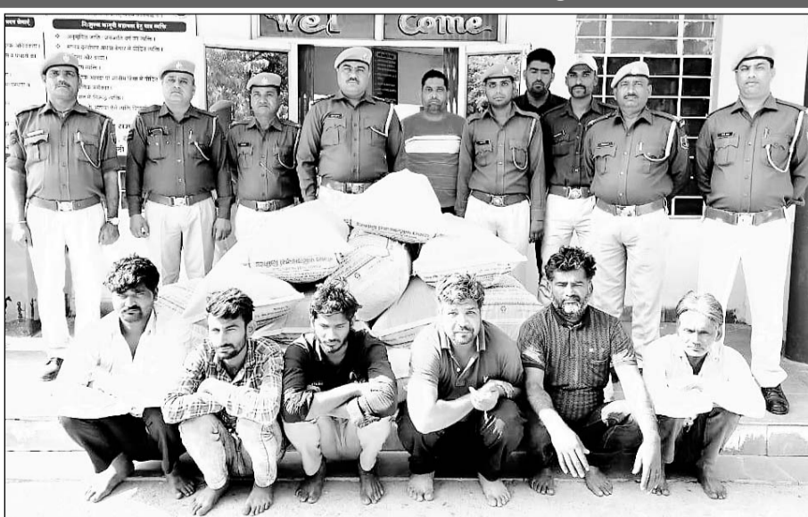
हिंडोली पुलिस की गिरफ्त में अन्तर्राज्यीय गांजा तस्करी गैंग के आरोपी एवं जप्त गांजा।

बूंदी, (निर्स)। थाना हिंडोली पुलिस ने सोमवार को जयपुर सीएसटी की सूचना एवं सहयोग से मादक पदार्थ की तस्करी करते अंतर राज्य तस्करी को गिरफ्तार किया है। अभियुक्तों के पास से बरामद टैपो ट्रैवल्स गाड़ी से 287 किलो गांजा बरामद किया गया। जिसकी बाजार में कीमत करीब 30 लाख रुपये है। विशाखापट्टनम से गांजा तस्करी कर तस्करी राजस्थान सप्लाई करने के लिए आ रहे थे। पुलिस ने एस्कॉर्ट में प्रयुक्त मार्शलि स्विच डिजायर गाड़ी भी जब्त की है।