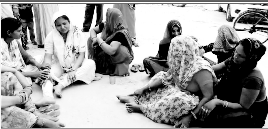
प्रसूता की मौत के बाद शोक में डूबा परिवार।

डॉक्टर परिजनों से ब्लड की व्यवस्था करने की कहते रहे और प्रसूता की मौत हो गई