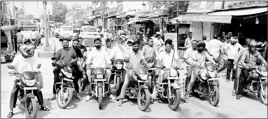
घटना के विरोध में हिन्दू संगठनों ने शहर के मुख्य बाजार में बाइक रैली निकाली।

आरएसी की टुकड़ी भी तैनात रही। इंटरनेट सेवा आगामी आदेश तक बंद कर दी गई और चूरू जिले में कलेक्टर के आदेश पर धारा 144 लागू की गई। आवश्यक सेवाओं को छोड़कर पूर्णतया बाजार बंद रहे। बंद के चलते शहर में वाहनों की आवाजाही भी काफी कम रही। सुरक्षा व्यवस्था को लेकर पुलिस शहर के मुख्य बाजार में तैनात थी। वहीं बाजारों में घोर सन्नाटा पसर रहा और शहरवासियों ने इस कायरता पूर्ण कृत्य की कड़ी निन्दा की। वहीं इस घटना को लेकर लोगों में काफी आक्रोश देखने को मिला।