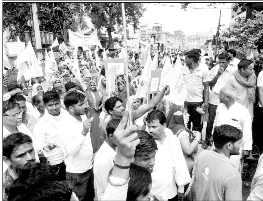
अलवर के राजगढ़ में 12 प्रतिशत अलग से आरक्षण की मांग को लेकर सैनी समाज ने रैली निकाली।

सैनी समाज के हजारों लोगों ने रैली निकाल कर प्रदर्शन किया