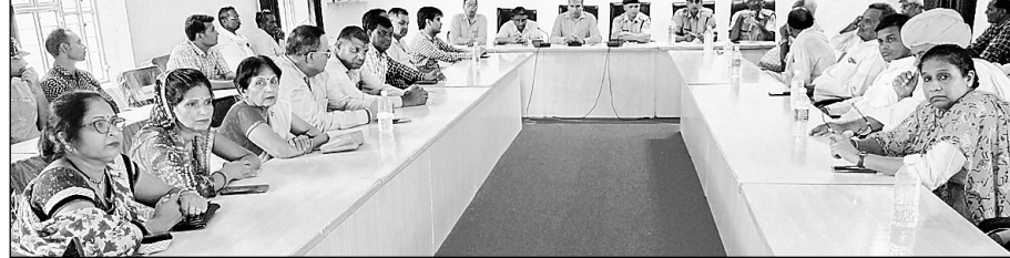
मालपुरा एसडीएम ने सुरक्षा व्यवस्था को लेकर शांति समिति की बैठक ली।

पुलिस व प्रशासन ने शहर में फ्लैग मार्च कर ली शांति समिति की बैठक