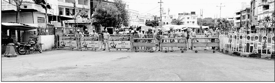
उदयपुर में कर्फ्यूग्रस्त इलाकों व शहर में चप्पे-चप्पे पर पुलिस बल तैनात रहा।