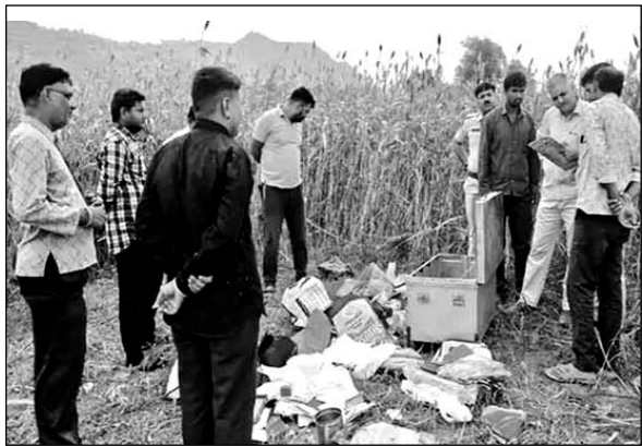
पुलिस ने खेत में पड़े बक्सों की जानकारी ली।

सोओ साउथ ओमप्रकाश ने बताया कि बीती देर रात अलवर गेट थाना क्षेत्र में करीब 12 से 3 बजे अज्ञात नकबजनों ने चोरी की वारदात अंजाम दी है। चोरों ने जैन मंदिर के पास चार दुकानों के ताले तोड़े, लेकिन तीन दुकानों से सामान चोरी किया। एक मेडिकल की दुकान के