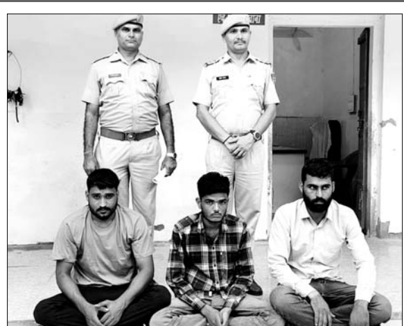
पुलिस ने हनीट्रेप मामले में तीन आरोपियों को गिरफ्तार किया।