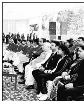
पढ़ने के साथ स्वास्थ्य पर भी ध्यान देने, अनिर्णय से बचने आदि को अपनाते जीवन को उसव बनाते परीक्षा में तनाव से मुक्त रहकर उसका सामना करने पर जोर दिया।

प्रधानमंत्री नरेंद्र मोदी ने छात्रों, अभिभावकों और शिक्षकों से बातचीत करते हुए परीक्षा में होने वाले तनाव और सफलता की तैयारी पर चर्चा की। प्रधानमंत्री मोदी ने कहा कि जीवन में यदि प्रतिस्पर्द्धा और चुनौतियां नहीं हो तो जीवन नीरस हो जाएगा। पर, प्रतिस्पर्द्धा स्वस्थ हो, द्वेष भाव लिए नहीं हो। उन्होंने परीक्षा को तनाव के बजाय उसे सहजता में लेने और जीवन में संतुलन बनाए रखने का आह्वान किया।