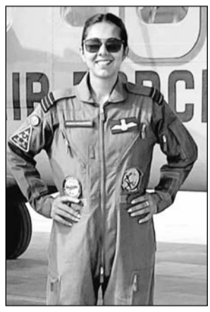
एक डकोटा विमान और दो डोर्मिन शामिल थे।

वह फॉर्मेशन के एक डोर्मिन विमान का संचालन कर रही थीं जिसमें