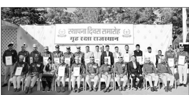
राजस्थान गृह रक्षा स्थापना दिवस समारोह में शनिवार को उत्कृष्ट सेवा के लिए अधिकारियों को सम्मानित किया गया।