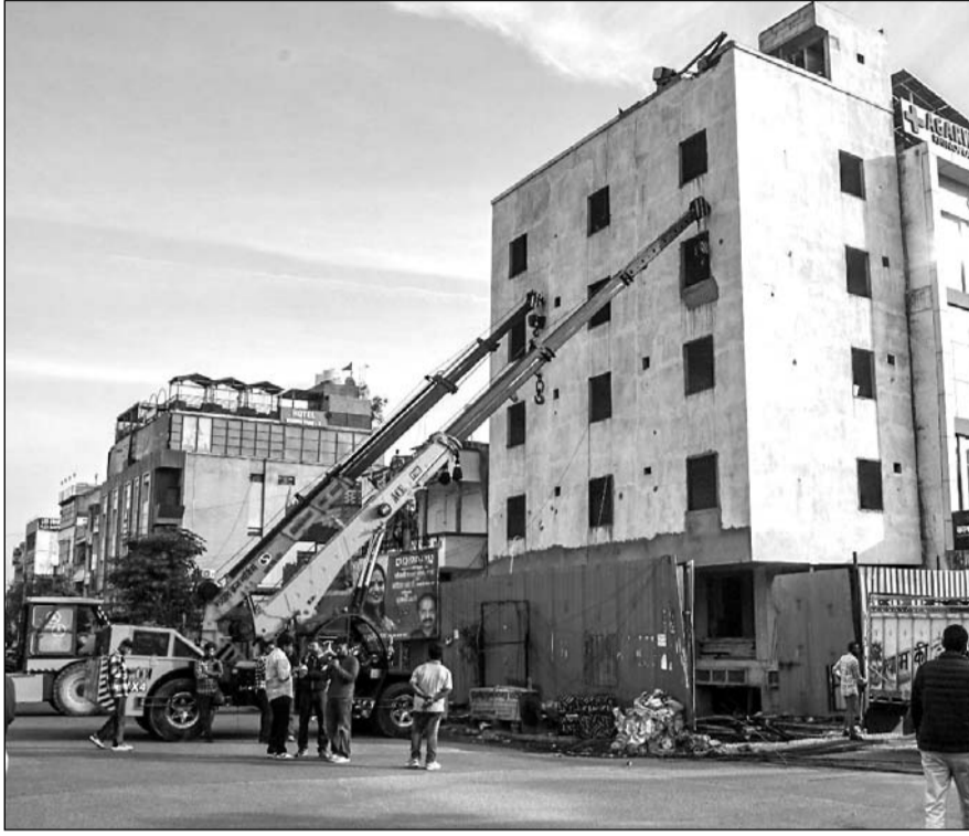
मालवीय नगर इलाके में गिरधर मार्ग पर निर्माणाधीन बिल्डिंग में दरारें आने और इमारत का झुकाव एक ओर से हड़कंप मच गया। इस घटना से आसपास के लोगों में दहशत का माहौल बन गया। पुलिस ने मौके पर पहुंचकर पूरा इलाका खाली करवाया, स्थानीय लोगों ने भी घटना के बारे में प्रशासन को जानकारी दी।

रोड पार करते ही पेट्रोल पंप है। बिल्डिंग के दूसरी तरफ एक कॉमर्सियल बिल्डिंग बनी है। बताया जा रहा है कि शनिवार को निर्माणाधीन बिल्डिंग के बेसमेंट में मिट्टी खिसकने से पूरी इमारत में दरारें आई हैं। सूचना