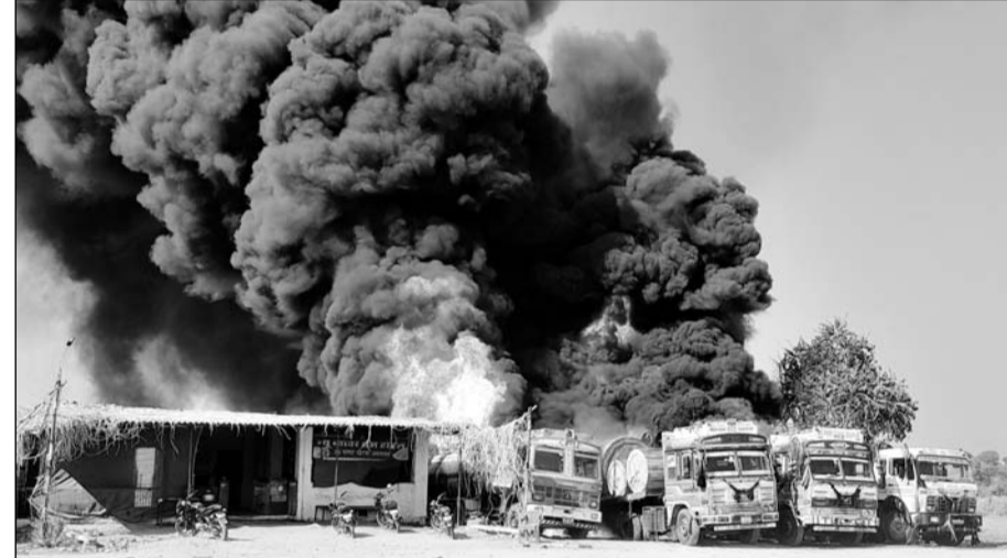
बाँयोडीजल रिफिल करने के दौरान हुई स्पार्किंग के बाद लगी आग से वाहन जलने लगे।

आग की लपटें और धुँआ मानो आसमान छूने की कोशिश करने लगे जो शहर से भी दिखाई दे रहा था। श्री सीमेंट और अग्निशमन को सूचित किये जाने के बाद आग बुझाने के भरसक प्रयास किये जा रहे थे लेकिन वो काबू में ही नहीं आ रही थी। चारों वाहन और आसपास खड़े अन्य ट्रेलर भी बंद खिड़की दरवाजे के खड़े थे। घटनास्थल के आसपास खड़े ट्रेलरों को भी जैसे जैसे जानकार लोगों द्वारा चालू करने के बाद दूर खड़ा करवाया गया जैसे जैसे लोगों को खबर लगी हज़ारों की भीड़ लग गई जिसे पुलिस द्वारा बलपूर्वक हटाया गया। वहां खड़ी मोटर साइकिलों के मालिक भी नहीं मिले जबकि सभी के हेंडिल