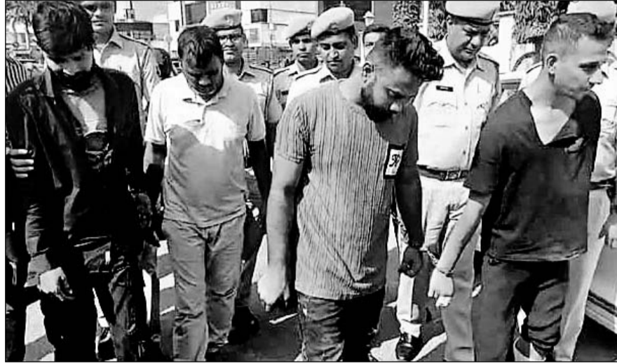
पुलिस ने अपहरण के मामले में चारों आरोपियों की अजमेर शहर में परेड कराई।