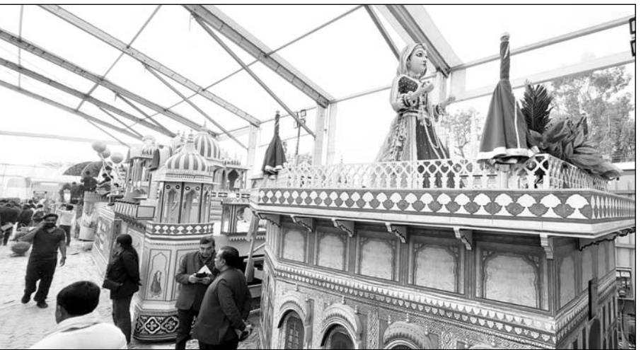
लाल किला प्रांगण में निकलने वाली झांकी का दृश्य।

इस वर्ष गणतंत्र दिवस परेड में विभिन्न राज्यों सहित केन्द्रीय मंत्रालयों की 31 झांकियां शामिल होंगी, जबकि लाल किला प्रांगण में 26 से 31 जनवरी तक आयोजित होने वाले भारत पर्व-2025 में मुख्य परेड में शामिल झांकियों सहित विभिन्न राज्यों की 43 झांकियां भाग लेंगी। हालांकि इस बार राजस्थान की झांकी गणतंत्र दिवस की परेड में कर्तव्य पथ से निकलने वाली चुनिंदा झांकियों में तो शामिल नहीं होगी, लेकिन दिल्ली के ऐतिहासिक लाल किला प्रांगण में आयोजित होने वाले भारत पर्व-2025 में राजस्थान की झांकी सोणो राजस्थान भी मुख्य