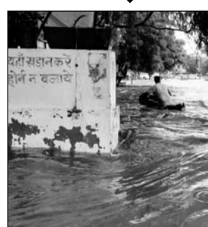
जोधपुर में मूसलाधार बारिश से कई गाड़ियां पानी में बहती नजर आईं।

जोधपुर, (कांस)। प्रदेशभर में दक्षिण-पश्चिमी मानसून फिर से सक्रिय होने के साथ जोधपुर में जमकर बारिश हो रही है। औसत से कई ज्यादा बारिश इस बार में मानसून में हो चुकी है। अभी इसका प्रभाव सितंबर माह तक रहने के आसार हैं। मारवाड़ में भी इस बार मानसून काफी मेहरबान रहा है। लगातार बारिश से खेतों में पहले से भरा पानी सूखने का नाम नहीं ले रहा है। मारवाड़ के कई हिस्सों में मंगलवार की रात से ही बादल टूटकर बरस रहे हैं। बुधवार को जोधपुर शहर और ग्रामीण इलाकों में डेढ़ से दो घंटे तक जमकर बारिश हुई। इससे शहर की सड़कें तालाब और तलेया बन गईं। सुबह के समय ड्यूटी पर जाने वाले लोग बारिश बंद होने का इंतजार करते रहे तो जो निकले वे बारिश के पानी में फंस गए।