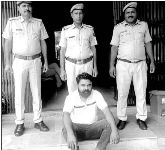
सिंधाना पुलिस ने डीजल व पेट्रोल की खरीद फरोख्त मामले में एक व्यक्ति को गिरफ्तार किया।

खेतड़ी, (निस)। सिंधाना पुलिस ने देर शाम को हरियाणा से लाकर क्षेत्र में डीजल व पेट्रोल की खरीद फरोख्त करने के मामले में कार्रवाई करते हुए एक व्यक्ति को गिरफ्तार किया है। इस दौरान पुलिस ने आरोपी के कब्जे से साढ़े तीन सौ लीटर डीजल व पेट्रोल बरामद किया है।