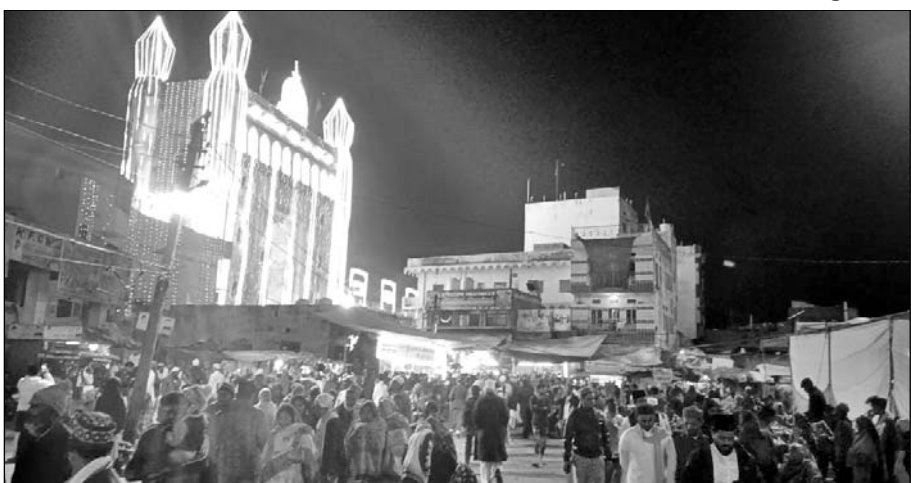
सालाना उर्स के मौके पर शनिवार को बड़ी तादाद में जायरीन दरगाह में पहुंचे।

सरवाड़, (निसं)। शहर स्थित हजरत ख्वाजा मोइनूद्दीन चिश्ती के बड़े साहबजादे हजरत ख्वाजा फखरुद्दीन चिश्ती की दरगाह के सालाना उर्स की विधिवत शुरुआत होने के साथ ही दरगाह में विभिन्न धार्मिक रस्मों की भी शुरुआत होने लगी है।