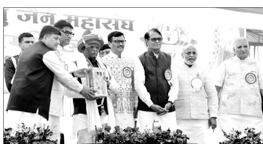
समारोह के दौरान राज्यपाल हरिभाऊ किशनराव बागड़े का स्वागत सम्मान किया गया।