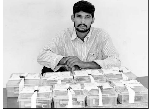
चंदवाजी थाना पुलिस ने अवैध हथियारों के साथ आरोपी को पकड़ा।

■ 4 स्वचालित पिस्टल मय 5 मैगजीन व 4 देशी कट्टे सहित 16 जिन्दा कारतूस जब्त