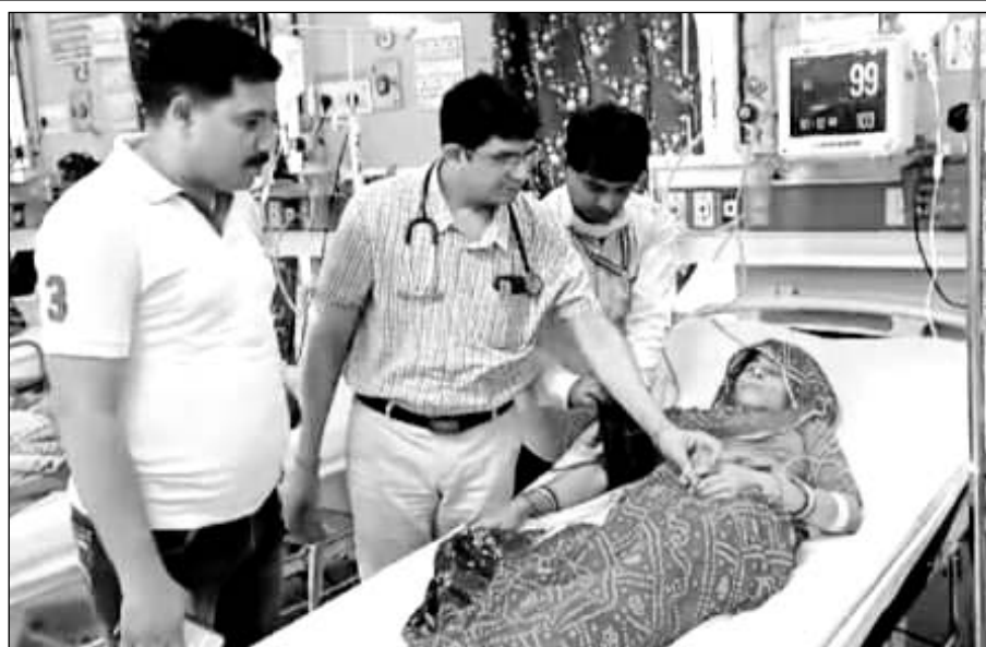
सांप के काटने से अचेत महिला को अस्पताल में भर्ती कराया।

मांची गांव में लगातार हो रही सर्पदंश की घटनाओं को देखते हुए क्षेत्रीय वन अधिकारी ने बताया कि गांव में सांपों की अधिकता की सूचना पर चार कार्टों की टीम गठित की गई और करीब आधा दर्जन से अधिक सांपों को पडकर सुरक्षित जंगल में छोड़ा गया। यही नहीं करौली जिला पुलिस अधीक्षक वृजेश ज्योति उपाध्याय के निवास पर रिकवार को लोन में एक लंबा सांप निकला, जिससे अफरा-तफरी सी मच गई। पास ही