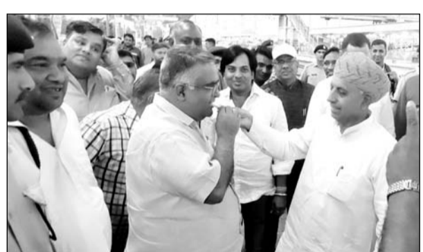
ट्रेन का ठहराव होने पर सांसद भारीरथ चौधरी ने हर्ष व्यक्त किया।

स्थानीय रेलवे स्टेशन पर ट्रेन उपलब्ध हो सकेगी। उन्होंने बताया की गाडी संख्या 19409 अहमदाबाद-गोरखपुर ट्रेन अहमदाबाद से प्रस्थान करेगी। इस ट्रेन का किशनगढ़ रेलवे स्टेशन पर सांय 06.43 बजे आगमन होगा। साथ ही गाडी संख्या 19410 गोरखपुर-अहमदाबाद ट्रेन गोरखपुर से प्रस्थान कर रात्री 2 बजे किशनगढ़ रेलवे स्टेशन पहुंचेगी। समारोह में किशनगढ़ मार्बल एडुसिएशन अध्यक्ष