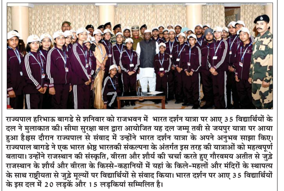
राज्यपाल हरिभाऊ बागडे ने शनिवार को राजभवन में भारत दर्शन यात्रा पर आए 35 विद्यार्थियों के दल ने मुलाकात की। सीमा सुरक्षा बल द्वारा आयोजित यह दल जम्मू तवी से जयपुर यात्रा पर आया हुआ है। इस दौरान राज्यपाल से संवाद में उन्होंने भारत दर्शन यात्रा के अपने अनुभव साझा किए। राज्यपाल बागडे ने एक भारत श्रेष्ठ भारत की संकल्पना के अंतर्गत इस तरह की यात्राओं को महत्वपूर्ण बताया। उन्होंने राजस्थान की संस्कृति, वीरता और शौर्य की चर्चा करते हुए गौरवमय अतीत से जुड़े राजस्थान के शौर्य और वीरता के किस्से-कहानियों में यहां के किले-महलों और मंदिरों के स्थापत्य के साथ राष्ट्रीयता से जुड़े मूल्यों पर विद्यार्थियों से संवाद किया। भारत दर्शन पर आए 35 विद्यार्थियों के इस दल में 20 लड़कें और 15 लड़कियां सम्मिलित हैं।