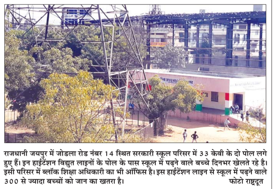
राजधानी जयपुर में जोडाला रोड नंबर 14 स्थित सरकारी स्कूल परिसर में 33 केवी के दो पोल लगे हुए हैं। इन हाईड्रेशन विद्युत लाइनों के पोल के पास स्कूल में पढ़ने वाले बच्चे दिनभर खेलते रहे हैं। इसी परिसर में ब्लॉक शिक्षा अधिकारी का भी ऑफिस है। इस हाईड्रेशन लाइन से स्कूल में पढ़ने वाले 300 से ज्यादा बच्चों को जान का खतरा है।