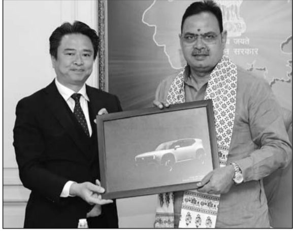
मुख्यमंत्री भजनलाल शर्मा ने शनिवार को मुख्यमंत्री कार्यालय में होण्डा कार्स इंडिया लिमिटेड के प्रतिनिधिमंडल के साथ बैठक में होण्डा के पहले ईवी मॉडल (होण्डा 0 अल्फा) का अनावरण किया।

जयपुर (कासं)। होण्डा की ओर से पहला इलेक्ट्रिक वाहन प्रदेश के टपूकड़ा संयंत्र में बनेगा, जिसका उत्पादन इसी वर्ष शुरू होगा। मुख्यमंत्री भजनलाल शर्मा ने शनिवार को मुख्यमंत्री कार्यालय में होण्डा कार्स इंडिया लिमिटेड के प्रतिनिधिमंडल के साथ बैठक में होण्डा के पहले ईवी मॉडल (होण्डा 0 अल्फा) का अनावरण किया।