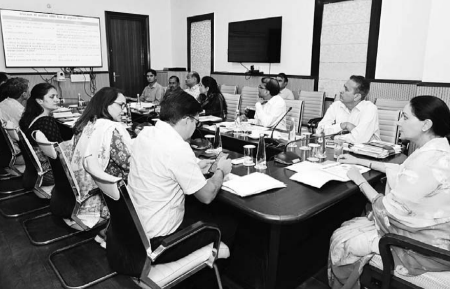
उपमुख्यमंत्री दिया कुमारी ने शनिवार को सचिवालय में महिला अधिकारिता निदेशालय द्वारा संचालित योजनाओं की समीक्षा की।

जयपुर। उपमुख्यमंत्री तथा महिला एवं बाल विकास मंत्री दिया कुमारी की अध्यक्षता में शनिवार को शासन सचिवालय में आयोजित बैठक में महिला अधिकारिता निदेशालय द्वारा संचालित महिला अधिकारों के संरक्षण में महिला सशक्तिकरण की विभिन्न योजनाओं की समीक्षा की गई। उपमुख्यमंत्री दिया कुमारी ने महिला अधिकारिता निदेशालय द्वारा संचालित उड़ान योजना के तहत बालिकाओं और महिलाओं को दिए जाने वाले निःशुल्क सेनेटरी नैपकिन आपूर्ति समयबद्धता से सुनिश्चित किए जाने के निर्देश दिए।