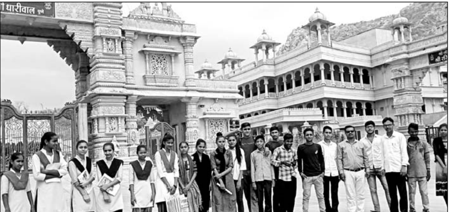
रेवदर के पास संघवी हंसराज कानाजी राजकीय उच्च माध्यमिक विद्यालय जीरावल में पन्द्रह दिवसीय समाज सेवा शिविर का शुभारंभ हुआ।

रेवदर, (निर्स)। रेवदर के निकट जीरावल कस्बे में स्थित संघवी हंसराज कानाजी राजकीय उच्च माध्यमिक विद्यालय जीरावल में आयोजित हो रहे पन्द्रह दिवसीय समाज सेवा शिविर में आज प्रार्थना सभा के साथ शुभारंभ किया गया।