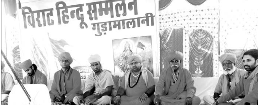
बाड़मेर जिले में गुड़ामालानी तहसील कार्यालय के सामने एक दिवसीय विराट हिन्दू सम्मेलन हुआ।