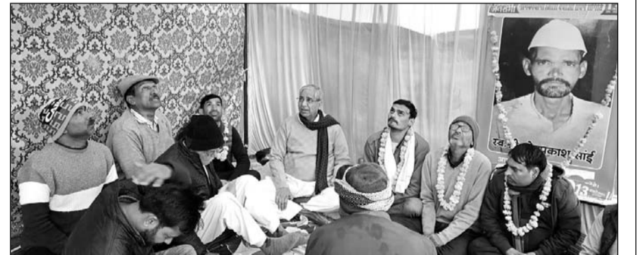
नीमकाथाना जिला बनाने की मांग को लेकर बारवें दिन भी भूख हड़ताल जारी रही।

■ नीमकाथाना, उदयपुरवाटी, खेतड़ी, श्रीमाधोपुर विधानसभा क्षेत्र के लोगों का विरोध प्रदर्शन जारी