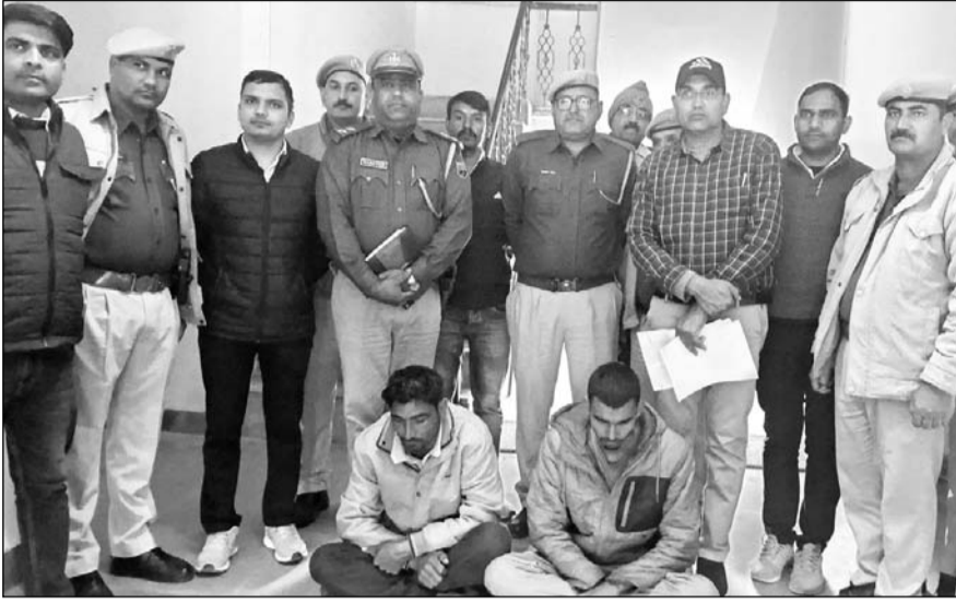
साइबर फीलड अभियान के तहत साइबर सेल और गच्छीपुरा थाना पुलिस ने कार्रवाई की।