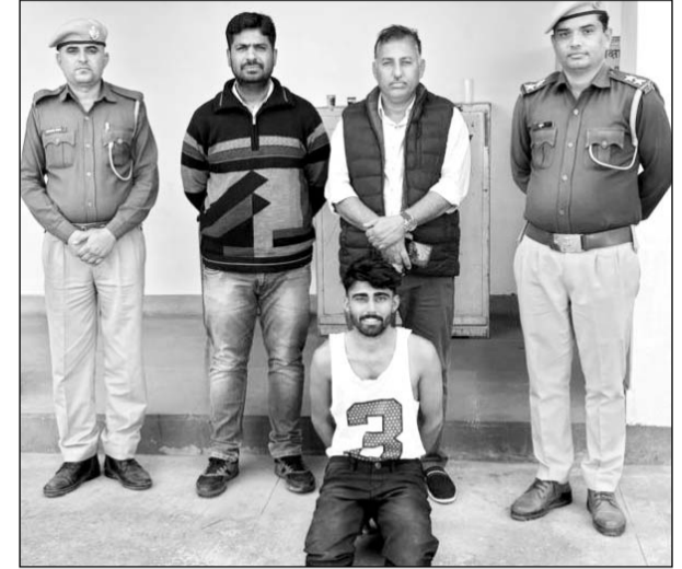
सीआईडी क्राइम ब्रांच रेंज सेल जोधपुर की टीम ने आरोपी होटल संचालक को गिरफ्तार किया।

जोधपुर, (निसं)। सीआईडी क्राइम ब्रांच रेंज सेल जोधपुर की टीम ने विदेशी कोयले की चोरी का खुलासा किया है। सिणधरी थाना क्षेत्र में मेगा हाईवे स्थित एक होटल के पीछे बने बाड़े में गुप्त रूप से यह कारोबार चल रहा था। मामले