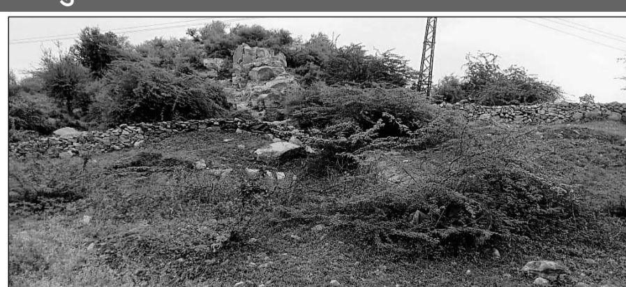
टोंक उपखण्ड के वन रेंज सोहेला में वृक्षारोपण सहित निर्माण कार्यो में जमकर धांधली करने का मामला सामने आया है।

टोंक, (निसं)। टोंक उपखण्ड के वन रेंज सोहेला में वृक्षारोपण सहित निर्माण कार्य में जमकर धांधली करने का मामला प्रकाश में आया है। प्राप्त जानकारी के अनुसार सोहेला वन क्षेत्र में बनी पुरानी दीवार को ही रंगरोगन कर नयी वॉल बताकर लाखों रूपये के फर्जी भुगतान उटाये गये हैं। सोहेला वन्य क्षेत्र में हर साल वन संरक्षण को लेकर प्लान्टेशन का निर्माण कराया जाता है लेकिन वन अफसर नियमों को दरकिनार कर राशि का आहरण करते रहे हैं। ऐसी ही एक कहानी सोहेला वन नका क्षेत्र वैष्णो देवी प्लांटेशन में भारी भ्रष्टाचार देखने को मिल रही है। राष्ट्रीय राजमार्ग 52 पर स्थित वैष्णो देवी मंदिर के पास बनाए गए प्लांटेशन में भारी भ्रष्टाचार किया गया है। उक्त प्लांटेशन पर कई बार प्लांटेशन बनाए जा चुके हैं जबकि अफसरों द्वारा बार-बार नाम