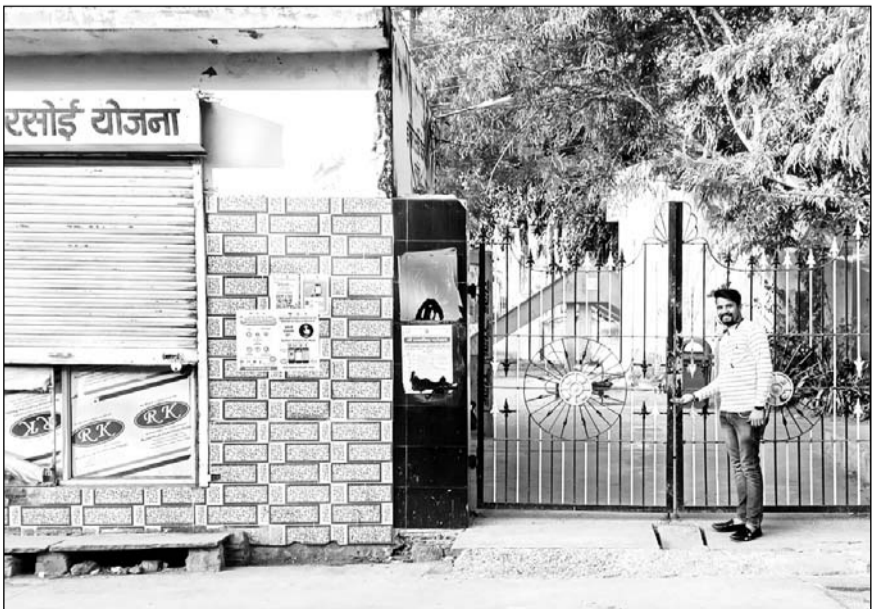
इंदिरा रसोई के नजदीक गेट पर ताला लगा होने से यहां आने वाले लोगों की परेशानी बढ़ गई है।

सांभरझील, (निर्स)। सार्वजनिक नेहरू बालोद्यान में नगर पालिका की दो दुकानों में इंदिरा रसोई भली भांती से संचालित हो रही है, जहां पर जरूरतमंद लोग भोजन कर अपनी