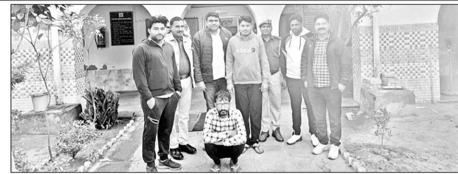
चिड़ावा पुलिस ने नकली नोट के साथ एक आरोपी को पकड़ा।

चिड़ावा, (निर्स)। चिड़ावा पुलिस ने शहर के बाईपास पर बड़ी कार्रवाई की है। पुलिस ने नकली नोट के साथ एक आरोपी को पकड़ा है और उसके कब्जे से 22 नोट बरामद किए हैं।