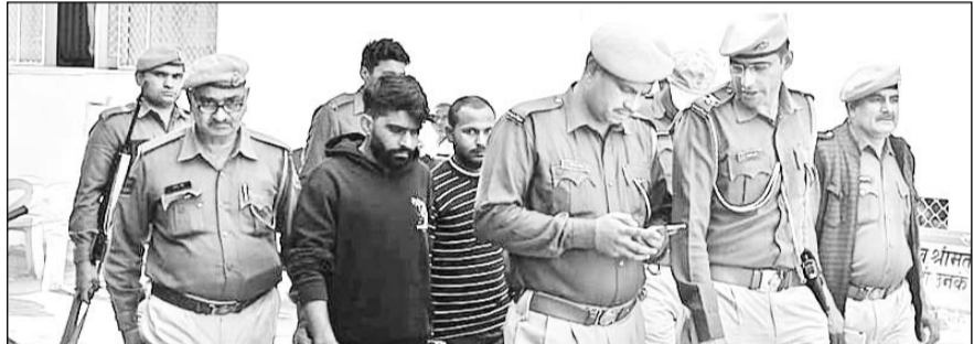
खेतड़ी उपखंड के शिमला बैंक डकैती के दो आरोपियों को पुलिस कड़ी सुरक्षा में कोर्ट लेकर आई।

खेतड़ी, (निर्स)। खेतड़ी उपखंड के शिमला बैंक डकैती के दो आरोपियों को पुलिस ने शनिवार को कड़ी सुरक्षा में कोर्ट में पेश किया है। आरोपियों ने गैंगवार की आशंका जताते हुए सुरक्षा मुहैया करवाने की मांग की थी।