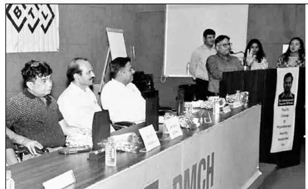
पेसिफिक में के-केट तकनीक पर कार्यशाला का आयोजन हुआ।

उदयपुर, (कासं)। पेसिफिक मेडिकल विवि के कॉलेज ऑफ फिजियोथेरेपी की ओर से दो दिवसीय राष्ट्रीय कार्यशाला का आयोजन किया गया। कार्यशाला को सम्बोधित करते हुए फिजियोथेरेपिस्ट डॉक्टर के.एम. अन्नामलाई ने फिजियोथेरेपी के क्षेत्र में नवीनतम तकनीकों के बारे में जानकारी