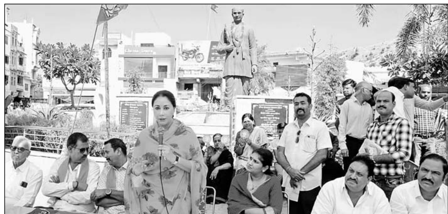
सेवा पखवाड़ा के तहत हुए कार्यक्रम को सांसद दीया कुमारी ने संबोधित किया।

राजसमन्द, (निर्सं)। एकात्म मानववाद और अंत्योदय के प्रणेता पंडित दीनदयाल उपाध्याय की जयंती पर सांसद दीया कुमारी ने राजनगर फव्वारा चौक स्थित उनकी प्रतिमा पर पुष्पांजलि अर्पित की।