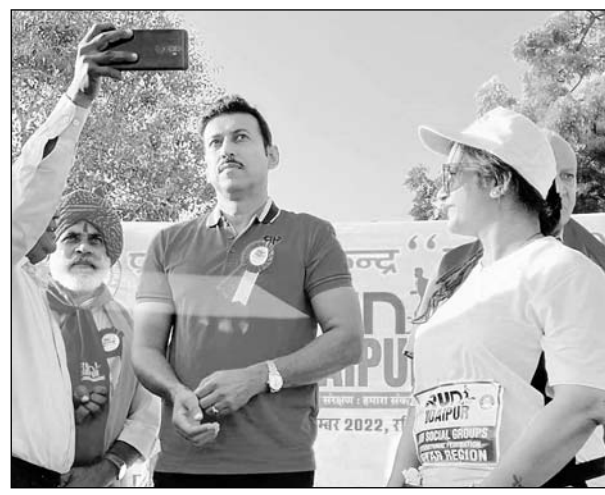
रन फॉर रैली में पूर्व केंद्रीय मंत्री राज्यवर्धन सिंह राठौड़ ने भाग लिया।

उदयपुर, (कासं)। प्रताप गौरव केन्द्र, नगर निगम एवं वन विभाग के संयुक्त तत्वाधान में रविवार को हेरिटेज संरक्षण के संदेश को लेकर रन फॉर उदयपुर रैली का आयोजन किया गया। इस कार्यक्रम में पूर्व केंद्रीय मंत्री राज्यवर्धन सिंह राठौड़ समेत कई गणमान्य अतिथि मौजूद रहे। रन फॉर उदयपुर में 1 हजार से ज्यादा युवाओं ने भाग लिया।