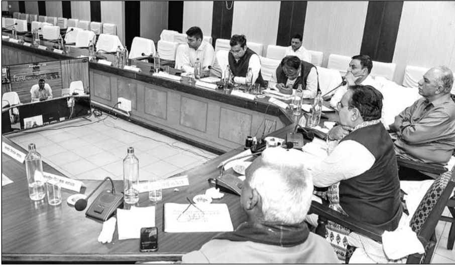
मुख्यमंत्री भजनलाल शर्मा ने शनिवार को भरतपुर के जिला कलेक्टर सभागार में वीडियो कॉन्फ्रेंसिंग के जरिए विभिन्न जिला कलेक्टरों से ओलावृष्टि पर वार्ता की।

कुछ जिलों में हुई ओलावृष्टि एवं इससे हुए नुकसान की विस्तृत जानकारी ली। शर्मा ने राजस्व विभाग के प्रमुख शासन सचिव को निर्देश दिए कि ओलावृष्टि से प्रभावित जिलों में फसल खराबे का आकलन करने के लिए शीघ्र गिरदावरी करवाई जाए। मुख्यमंत्री ने सीकर, चूरू, बीकानेर, झुंझुनू, एवं खैरथल-तिजारा के जिला कलेक्टर को निर्देशित किया कि गिरदावरी करवाकर रिपोर्ट शीघ्र भेजें। उन्होंने 7 डी रिपोर्ट को भी 5 मार्च तक प्रस्तुत करने के निर्देश दिए, जिससे