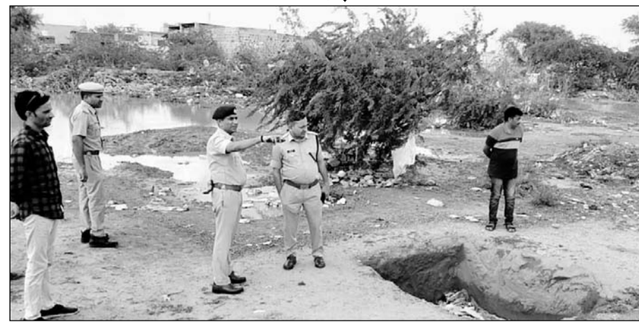
नागौर में घटना के बाद पुलिस ने मौका मुआयना कर जानकारी जुटाई।