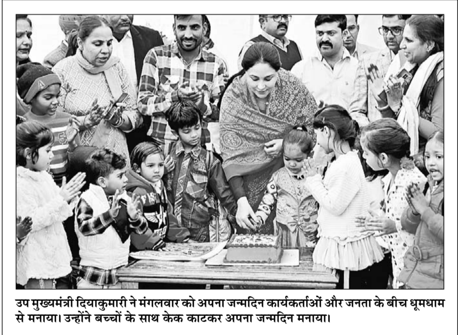
उप मुख्यमंत्री दियाकुमारी ने मंगलवार को अपना जन्मदिन कार्यक्रमों और जनता के बीच धूमधाम से मनाया। उन्होंने बच्चों के साथ केक काटकर अपना जन्मदिन मनाया।