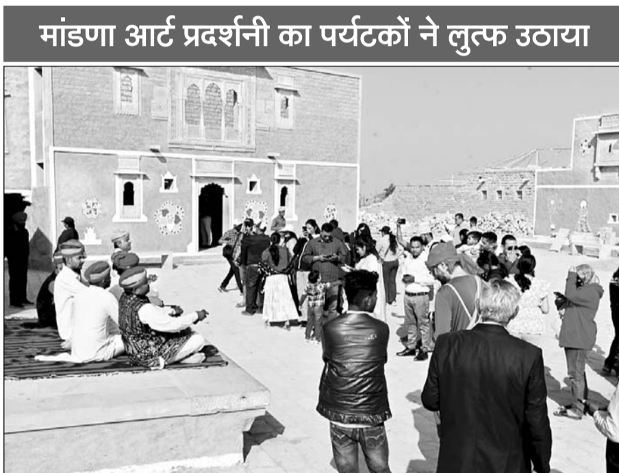
मांडणा आर्ट प्रदर्शनी का पर्यटकों ने लुत्फ उठाया

देशी-विदेशी सैलानियों ने स्थानीय मांडणों को बारिकी से देखा एवं अपने कैमरों में कैद किया।