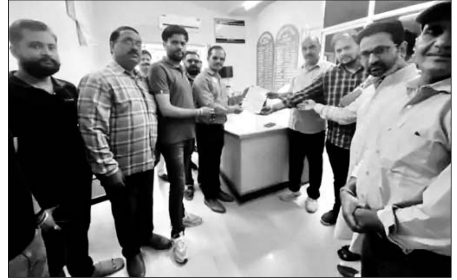
श्री राजपूत करणी सेना गंगापुर सिटी व राजपूत समाज ने जिला कलेक्टर के पीए को ज्ञापन दिया।

श्री राजपूत करणी सेना गंगापुर सिटी व राजपूत समाज ने जिला कलेक्टर कार्यालय में ज्ञापन दिया