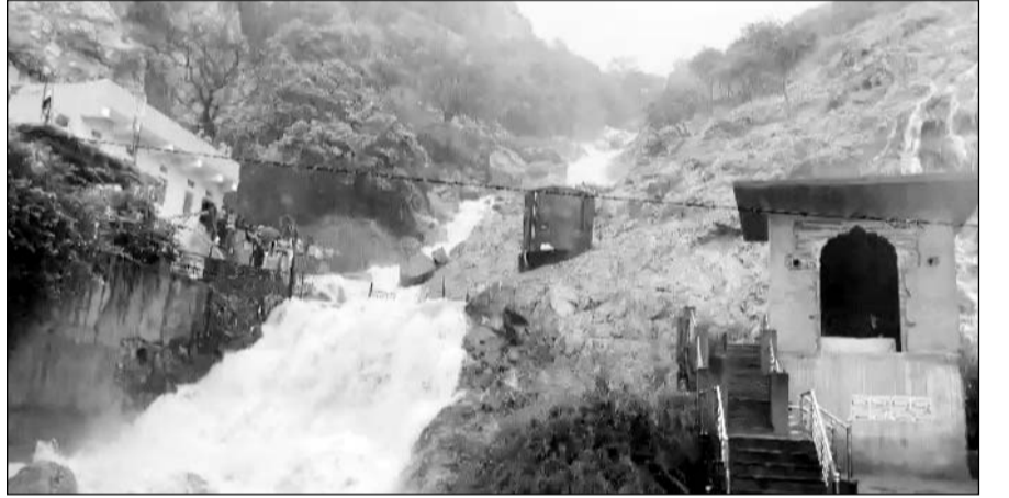
बरसात से सामोद के पास महार कलां स्थित मालेश्वर धाम की पहाड़ियों से नदी बहती नजर आई।

■ सामोद के वीर हनुमान जी मंदिर के पास स्थिति पहाड़ों से नदियों का पानी निकल पड़ा