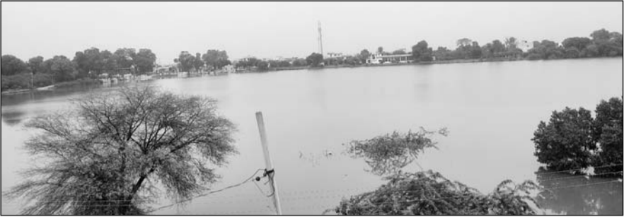
चाकसू कस्बे के बीचों-बीच स्थित मनहोरा तालाब ओवरफ्लो हो गया।

चाकसू, (निर्स)। मौसम विभाग की चेतावनी के मुताबिक क्षेत्र में तीन दिनों से लगातार बारिश हो रही है। आसमान से बरस रहे पानी से विधानसभा क्षेत्र के अधिकांशतः तालाब ओवरफ्लो हो गए हैं। बारिश से नगर पालिका क्षेत्र के निचले इलाकों और कच्चे-पक्के रास्तों में पानी भर गया है। बहुत से आम रास्ते तो कीचड़ में पड़े हैं जिससे लोगों का आवागमन दुश्वार हो गया है।