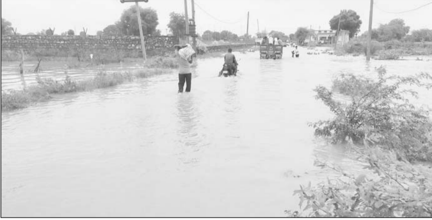
हिण्डौन सिटी शहर सहित आसपास के क्षेत्र में बारिश से कई इलाके जलमग्न हो गए।