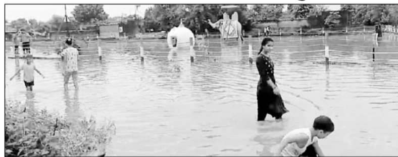
खेतड़ी में मूसलाधार बरसात से सड़कें पानी से लबालब हो गईं।

नहीं नहीं के कारण न्यू मार्केट, हाथी पार्क, आजाद मार्केट सहित आसपास के इलाके में आवासीय क्वार्टरों में पानी घुस गया। क्षेत्र में करीब डेढ़ घंटे तक मध्यम बरसात होने से सड़कें दरिया बन गईं। बरसात के कारण आसपास के क्षेत्र के निचले इलाकों में पानी घुस गया, जिससे ग्रामीणों को काफी परेशानियों का सामना करना पड़ा। सिंधाना के ग्रामीणों ने बताया कि इंदिरा कॉलोनी, प्रभात कॉलोनी, मुख्य बाजार स्थित मुस्लिम बस्ती में पानी की सही निकासी नहीं होने के कारण ग्रामीणों को अनेक परेशानियों का सामना करना पड़ रहा है। तहसील रिकार्ड के अनुसार 1.3 एमएम बारिश दर्ज की गई है।