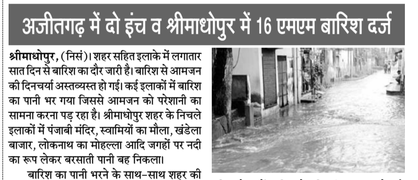
अजीतगढ़ में दो इंच व श्रीमाधोपुर में 16 एमएम बारिश दर्ज