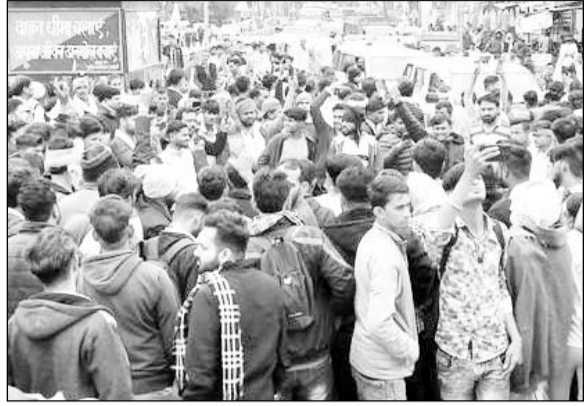
करौली कलेक्ट्रेट सफ़िकल पर पीड़ित परिवारजनों के साथ लोगों ने धरना देकर जाम लगाया।