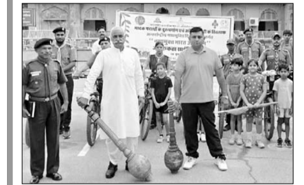
बीकानेर में नशे के खिलाफ जागरूकता साइकिल रैली निकालकर नशा नहीं करने का संदेश दिया।