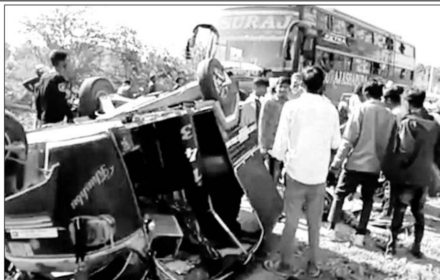
नया गांव मोड पर अनियंत्रित ऑटो पलटने के बाद जमा भीड़।

डूंगरपुर, (नि.सं.) जिले के दोवडा थानांतर्गत नया गांव सड़क पर अचानक बंदर आने से ऑटो पलट गया। जिसमें 10 कॉलेज की छात्राएं बंदी थीं, इनमें से 6 घायल हो गईं। घायलों को अस्पताल में भर्ती करवाया गया।