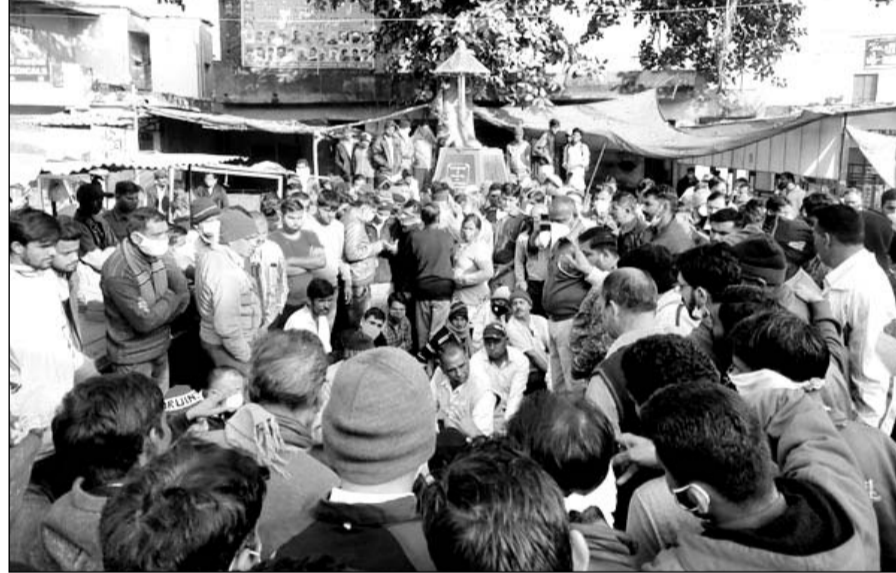
घटना के विरोध में डूंगरपुर-आसपुर मार्ग लोगों ने जाम कर दिया।