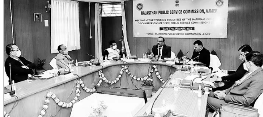
आरपीएससी में स्टैंडिंग कमेटी की बैठक के दौरान भाग लेते अधिकारी।