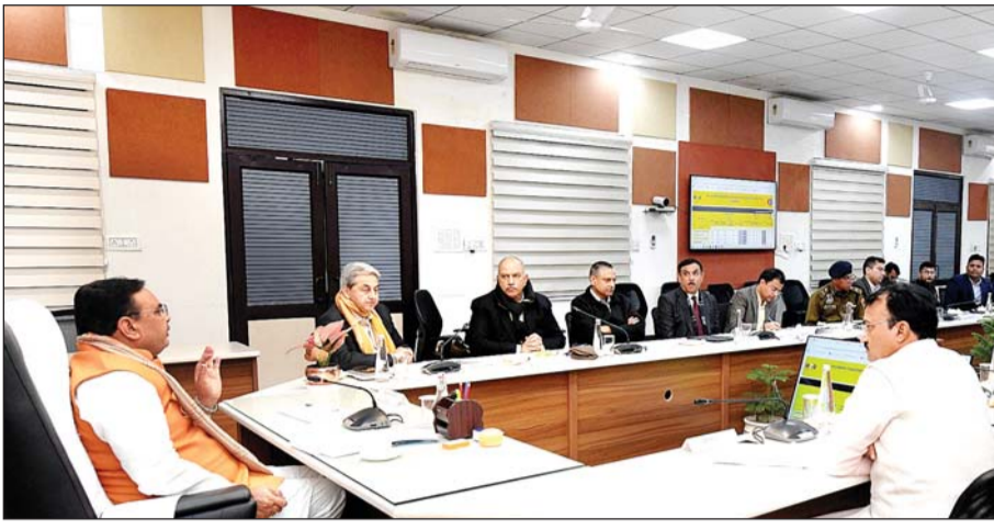
मुख्यमंत्री भजनलाल शर्मा ने गुरुवार को उनके निवास पर आयोजित सड़क सुरक्षा की समीक्षा बैठक को संबोधित किया।

■ 'बोरेवेल से होने वाली दुर्घटनाओं की करें रोकथाम, राज्यों भर में नहीं हो कोई भी खुला बोरेवेल'