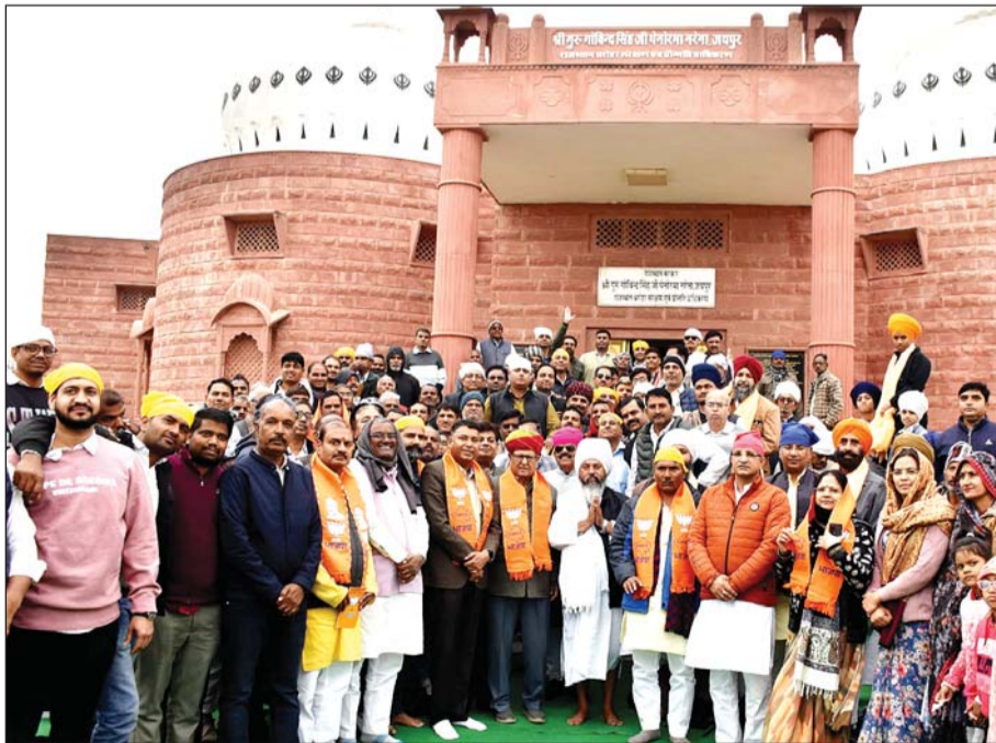
भाजपा जिला दक्षिण की ओर से नरेना गुरुद्वारे में वीर बाल दिवस कार्यक्रम का आयोजन किया।