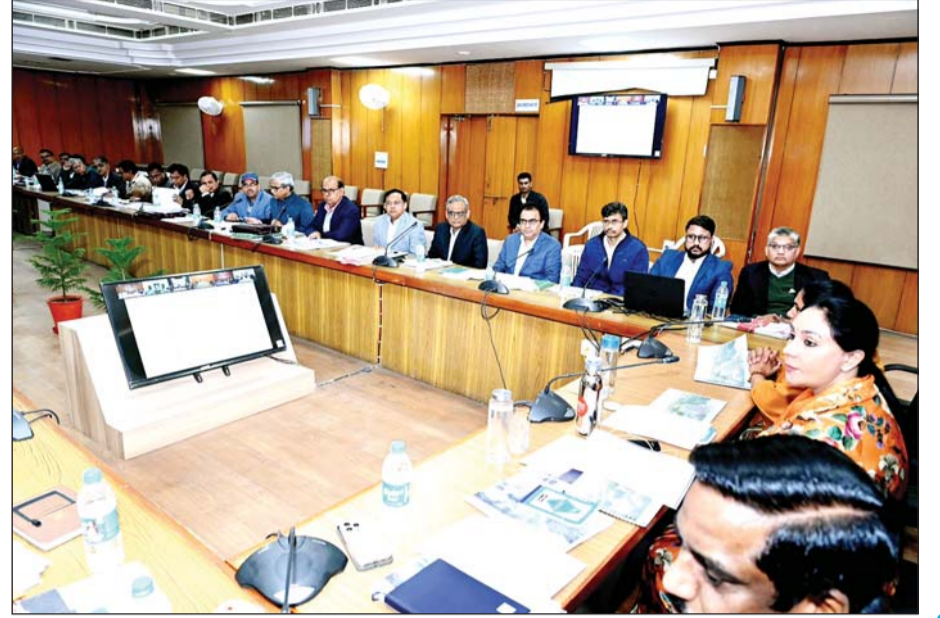
उपमुख्यमंत्री दिया कुमारी ने गुरुवार को निर्माण भवन में आयोजित समीक्षा बैठक को सम्बोधित किया।

■ सड़क दुर्घटनाओं में कमी लाने के लिए विशेष अभियान चलाया जायेगा : दिया कुमारी