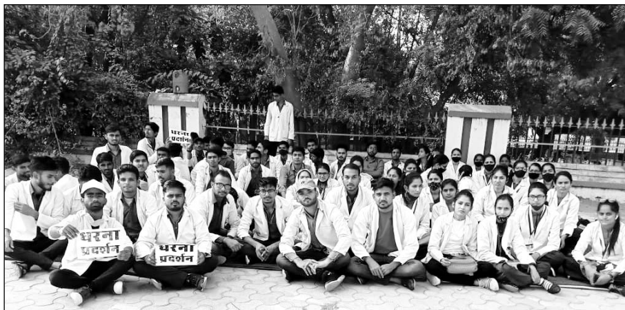
चुरू नर्सिंग कॉलेज के विद्यार्थी अपनी मांगों को लेकर धरने बैठे।

राज्य सरकार के मंत्रियों, विधायकों को कई बार अग्रगत करवाने के बावजूद आज तक किसी के कानों में जूं तक नहीं रंगी। इन परेशानियों को देखते हुये विद्यार्थियों को