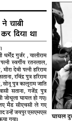
घायल दुल्हन का अस्पताल में उपचार किया।