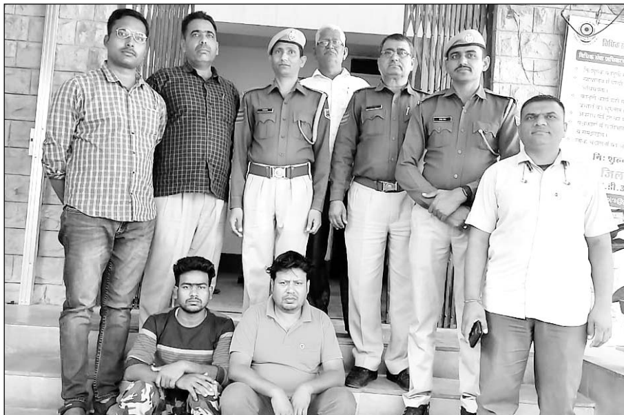
बाड़मेर में कोतवाली पुलिस ने सोना चोरी के मामले में दो आरोपियों को गिरफ्तार किया।

बाड़मेर कोतवाली थाना क्षेत्र से 102 ग्राम सोना चोरी कर फरार हुए थे आरोपी