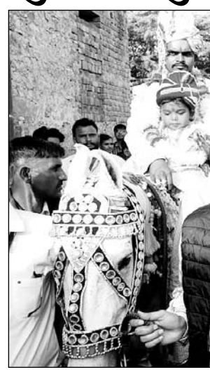
पंचायत कैरोडी में निकासी निकालते लोग।