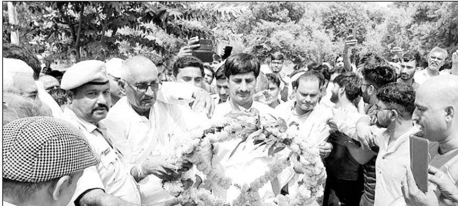
विधायक सहित विभिन्न जनप्रतिनिधियों ने पुण्यचक्र अर्पित किये।