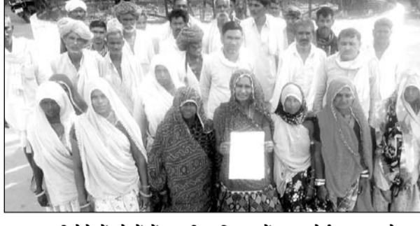
बनास नदी पेटे में खेतों में बजरी माफियाओं द्वारा बोर्ड फसल को नष्ट करने पर ज्ञापन देने आये ग्रामीण।

टोंक, (निसं)। देवली क्षेत्र के ग्राम सतवाडा के ग्रामीणों ने बनास नदी पेटे में उनके खेतों में बजरी माफियाओं द्वारा बोर्ड फसल को नष्ट करने एवं परेशान करने के मामले में अतिरिक्त जिला कलेक्टर को ज्ञापन दिया।