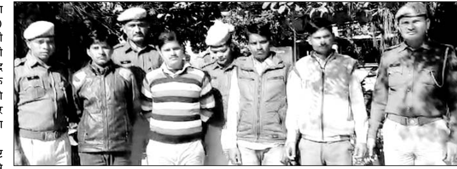
हत्या के दर्ज प्रकरण में आजीवन कारावास के आरोपी।