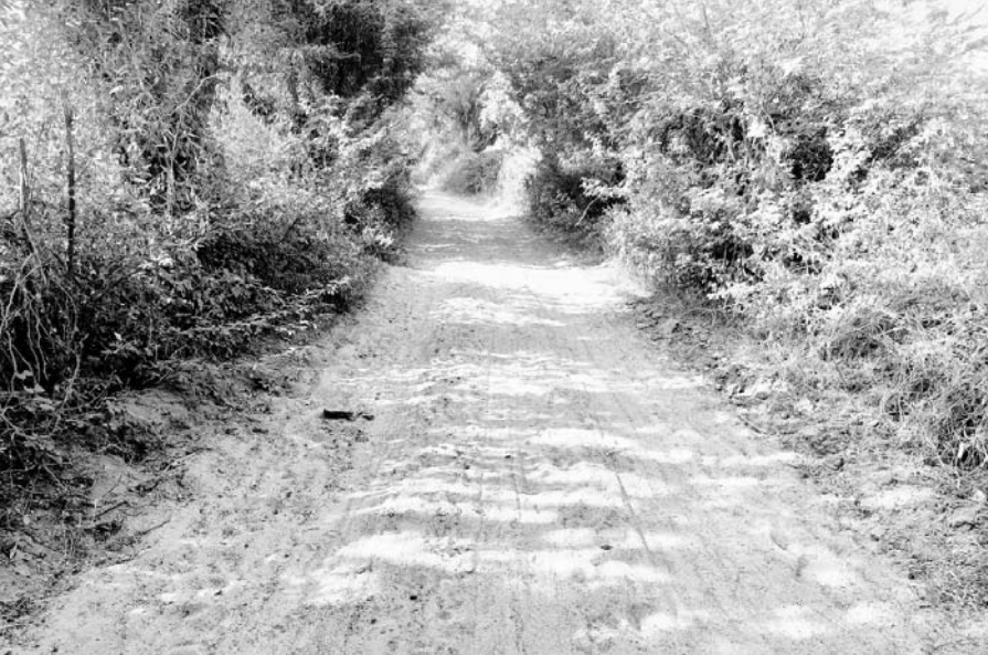
सायला के निकटवर्ती तूरा-सोनारिया ग्रेवल सड़क मार्ग पर रेत जमी हुई है।

लेकिन ग्राम विकास अधिकारी एवं ठेकेदार की कथित मिलीभगत के चलते उक्त ग्रेवल सड़क का निर्माण कार्य कागजों में ही पूर्ण बताकर दिनांक 29 मार्च 2022 को करीबन 7 लाख 20 हजार रूपये का भुगतान फर्म श्री अंबिका उद्योग के खाते में कर दिया गया। ग्रामीणों का कहना है कि तूरा गांव से सोनारिया स्कूल तक करीबन 4-5 साल से कोई ग्रेवल सड़क मार्ग नहीं बनाया गया है