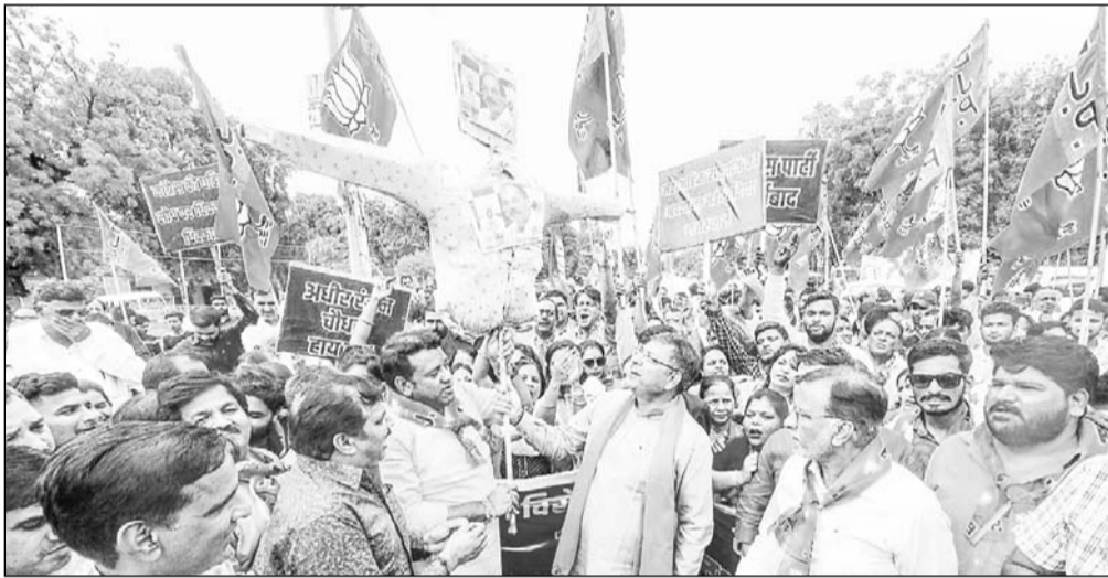
राष्ट्रपति द्रौपदी मुर्मू के खिलाफ कांग्रेस नेता अधीर रंजन द्वारा की गई अमर्यादित टिप्पणी के खिलाफ भाजपा के एसटी मोर्चा, महिला मोर्चा और युवा मोर्चा की ओर से जयपुर में धरना प्रदर्शन किया गया। इसमें भाजपा प्रदेशाध्यक्ष डॉ. सतीश पूनिया कार्यकर्ताओं के साथ शामिल हुए।

जयपुर। राष्ट्रपति द्रौपदी मुर्मू के खिलाफ कांग्रेस नेता अधीर रंजन द्वारा की गई अमर्यादित और अलोकतांत्रिक टिप्पणी के खिलाफ भाजपा ने प्रदेश के सभी जिलों में धरना प्रदर्शन कर अधीर रंजन के पुतले जलाए और कांग्रेस के राष्ट्रीय नेतृत्व के खिलाफ नारेबाजी की गई। इसी क्रम में एसटी मोर्चा, महिला मोर्चा और युवा मोर्चा द्वारा जयपुर में भी धरना प्रदर्शन किया गया और अधीर रंजन का पुतला जलाया गया, जिसमें भाजपा प्रदेशाध्यक्ष डॉ. सतीश पूनिया कार्यकर्ताओं के साथ शामिल हुए।