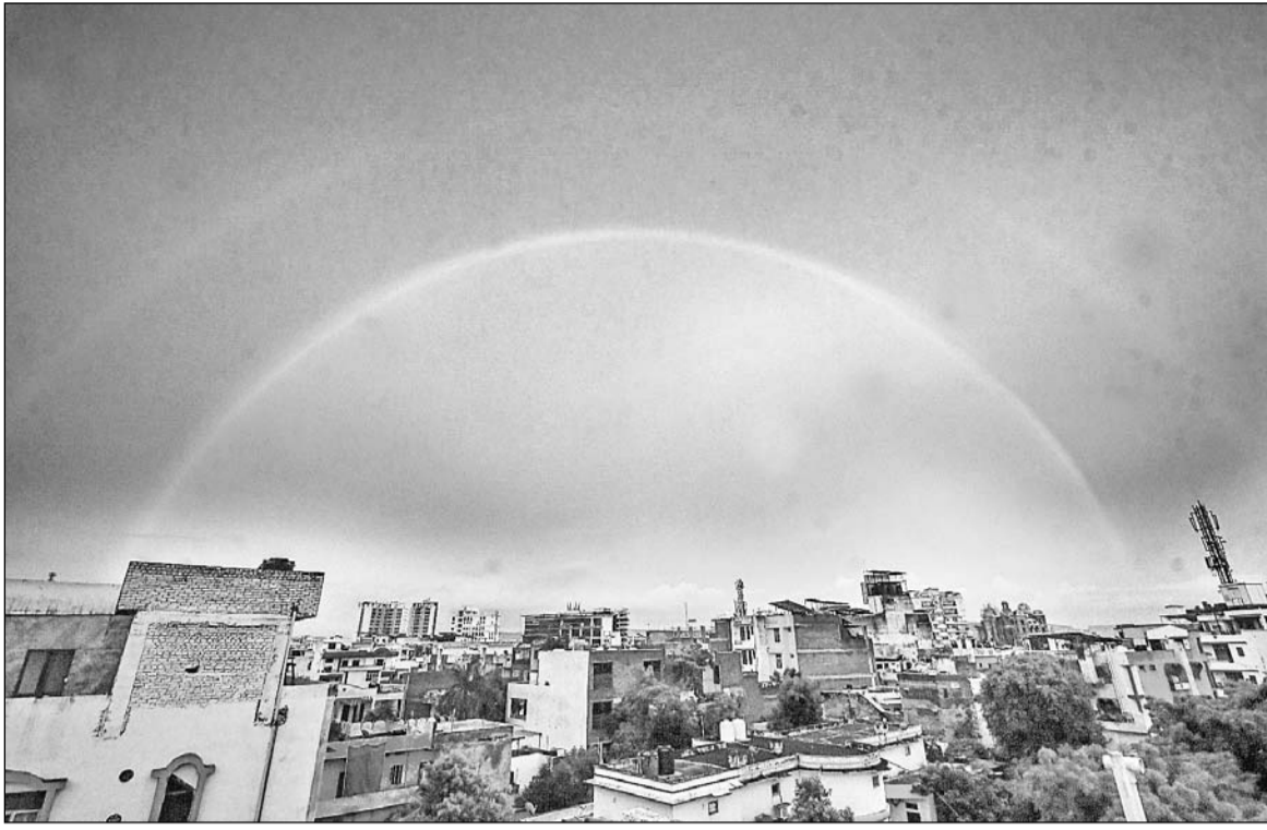
बारिश के मौसम में अक्सर इंद्र धनुष दिख जाया करता है, लेकिन जयपुर शहर में गुरुवार को लोगों को दो-दो इंद्र धनुष देखने का मौका मिला। हालांकि दूसरा वाला हल्का था।