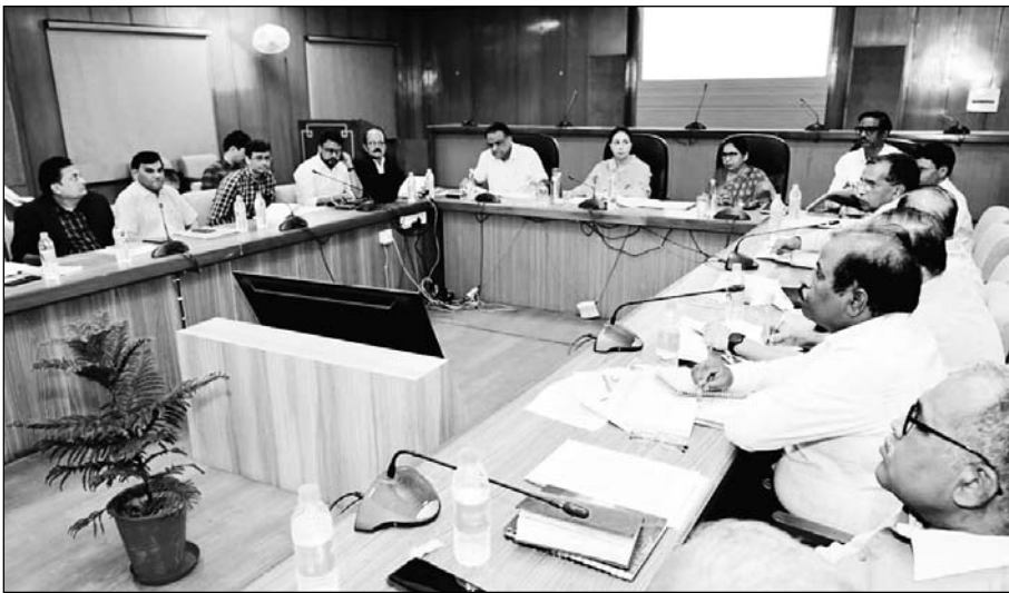
उपमुख्यमंत्री दिया कुमारी ने मंगलवार को निर्माण भवन में आयोजित सार्वजनिक निर्माण विभाग की समीक्षा बैठक को संबोधित किया।

रिपोर्ट प्रस्तुत करेंगे। उपमुख्यमंत्री ने बजट घोषणाओं, एनएचएआई, आरएसआरडीसी, आरएसएचए, सीआरआईएफ सहित विभिन्न प्रोजेक्ट्स की गति बढ़ाने और