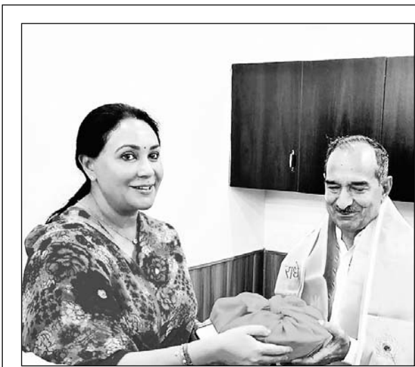
उपमुख्यमंत्री दिया कुमारी और प्रेमचंद बैरवा ने भाजपा के नवनियुक्त प्रदेश अध्यक्ष व राज्यसभा सांसद मदन राठौड़ से मुलाकात कर उनकी शुभकामनाएं दीं।

जयपुर। टीम 39 जहाँ चाह-वहाँ राह जन कल्याण ट्रस्ट एवं पानीपेच रोड व्यापार मंडल समिति ने रविवार को इंद्रा कॉलोनी पार्क, माधो कानन पार्क, अजमीह स्वर्णपार्क पार्क, डी-पार्क, डेजेंट कॉलोनी में वृक्षारोपण कार्यक्रम किया गया। टीम ने 251 पेड़-पौधे लगाए और उनकी सुरक्षा का संकल्प भी लिया।